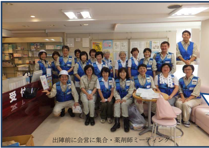
出陣前に会営に集合・薬剤師ミーティング